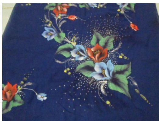
Gambar 2. Produk Jilbab Lukis Nasrafa