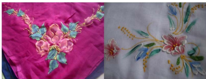
Gambar 1. Produk Jilbab Lukis Sejenis yang ada di pasaran