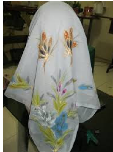
Gambar 7. Hijab Motif