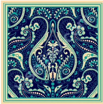
Kerudung Segi Empat Motif Batik Ornamental Paisley