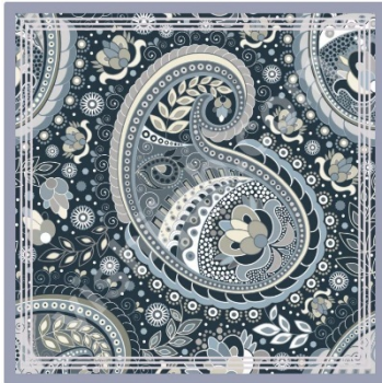
Hijab Batik Monochrome Paisley