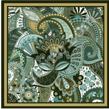
Jilbab Batik Green Paisley