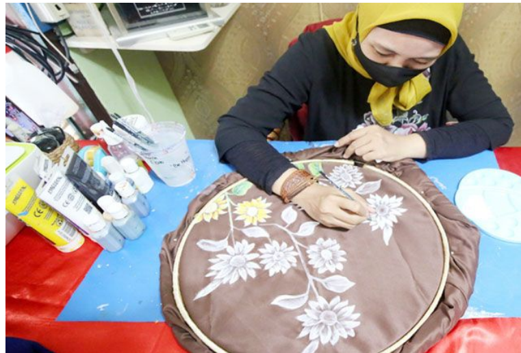
Gambar 5. Hijab Motif Nindy