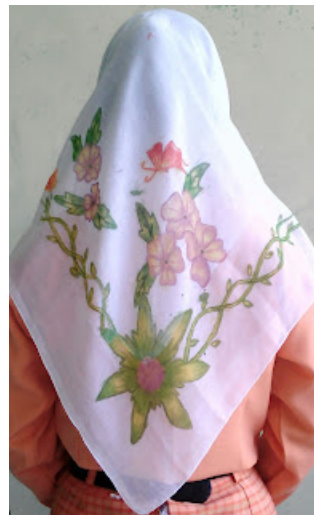
Gambar 6. Hijab Risa Kartika