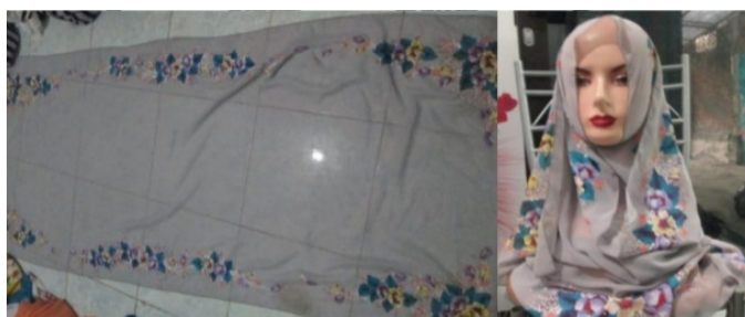
Gambar 3. Cara Pemakaian Jilbab Lukis Shifon Persegi Panjang (Pashmina) (kategori 1)