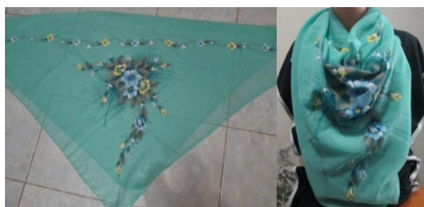
Gambar 4. Cara Pemakaian Jilbab Lukis Paris Persegi (kategori 2) Digunakan Sebagai Syal atau Scraf