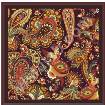
Jilbab Motif Batik Vintage Paisley