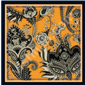
Hijab Batik Yellow Black Paisley